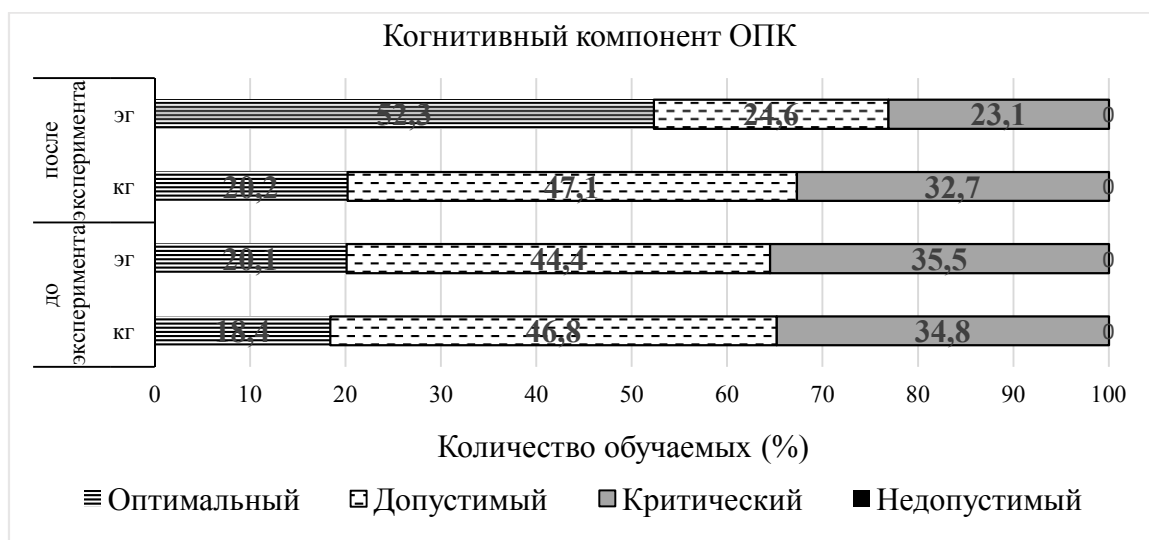
Рисунок 2 – Динамика уровней сформированности когнитивного компонента ОПК

Целевой показатель – когнитивный компонент ОПК представлен в виде диаграммы изменений в ЭГ и КГ на рисунке 2. В группе ЭГ увеличилось в 2,6 раза количество респондентов оптимального уровня с 20,1% до 52,3%. Произошло уменьшение количества респондентов допустимого уровня на 19,8 %, т.е. с 44,4% до 24,6 %, критического уровня – с 35,5% до 23,1%. В КГ динамика незначительная – от 1% до 2%.