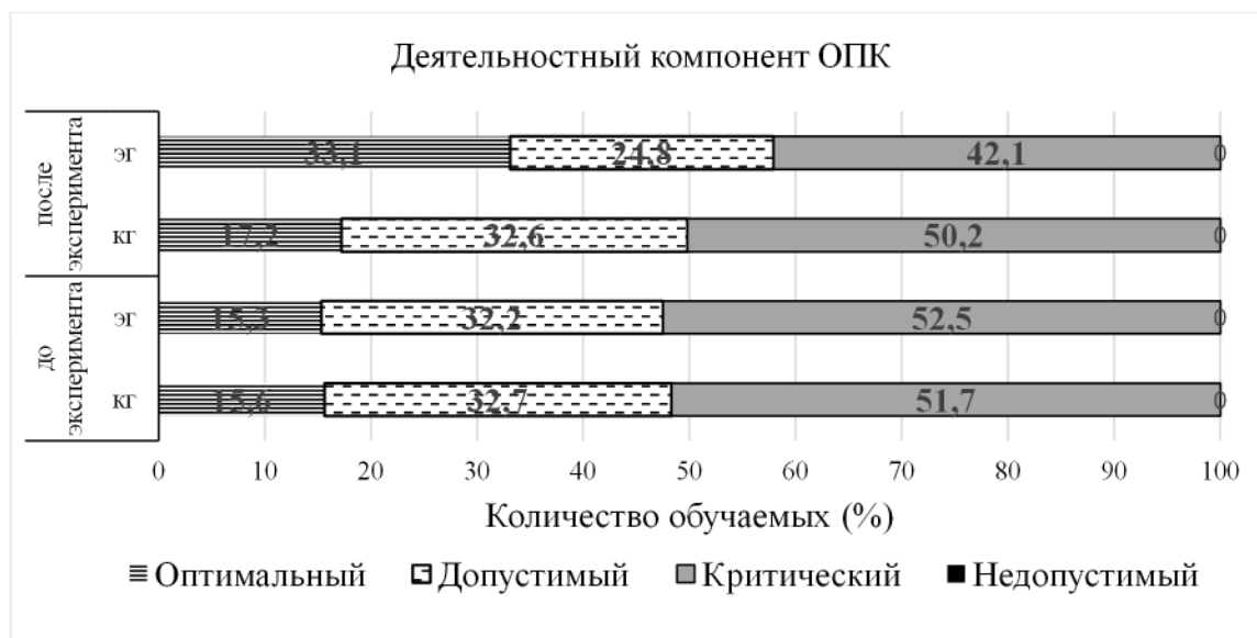
Рисунок 3 – Динамика уровней сформированности деятельностного компонента ОПК

уровне примерно в 2 раза (с 15,3% до 33,1%), на допустимом динамика составила 7,4% (с 32,2% до 24,8%), на критическом – 10,4%, т.е. с 52,5% до 42,1%.