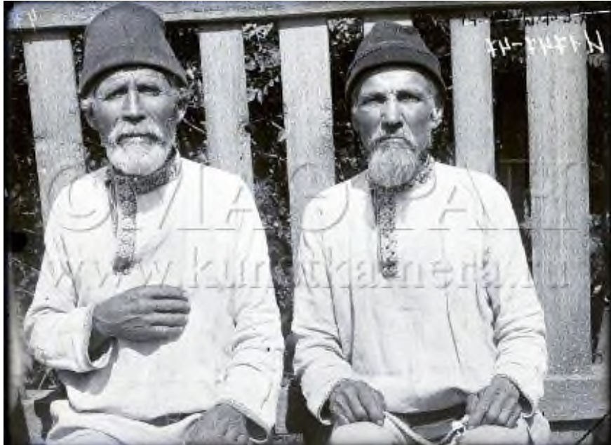
Фото-образ марийских священнослужителей

Название: "Карт" – марийский служитель культа